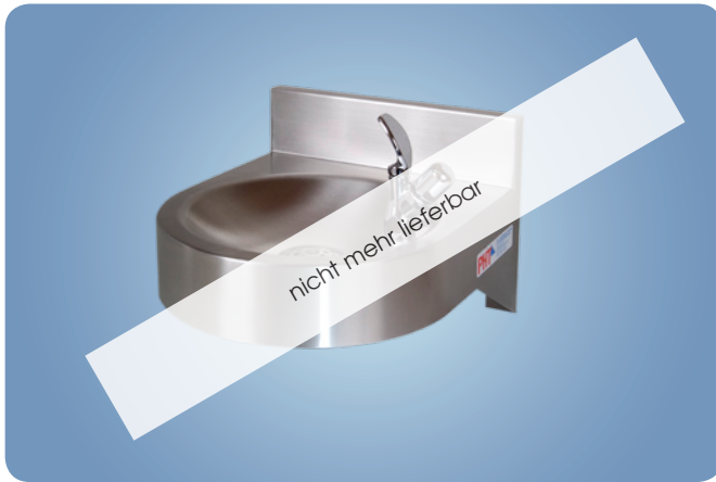
Typ WH 1