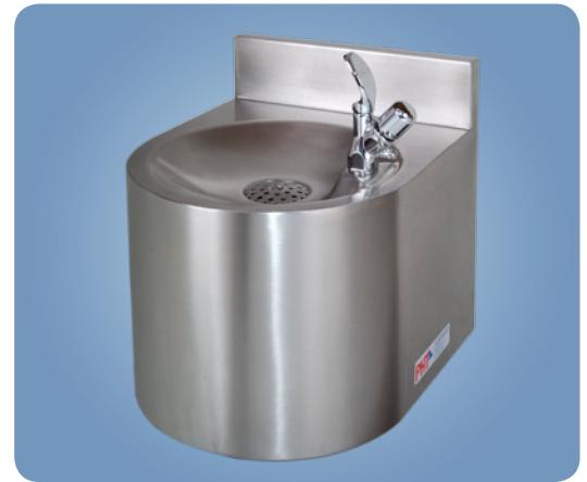
Typ WH 2