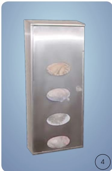
4 Spender Typ Depot